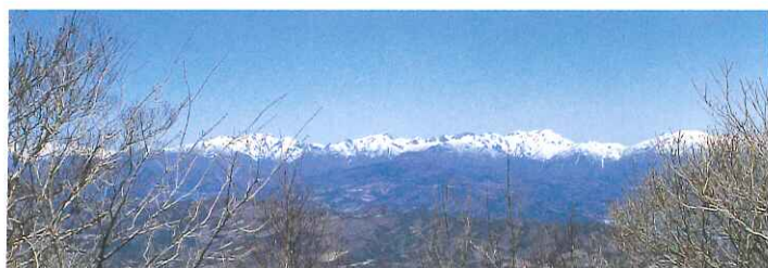
子持山山頂から谷川連峰を眺望

5 細長い箱を積み重ねたような、幅数mの安山岩が垂直に立っていますが、これが岩脈です。ここには3枚の岩脈が集中しています。箱を積んだような割れ目は柱状節理です。柱状節理は岩脈によく見られます。岩脈の両側を見ると凝灰角礫岩や溶岩の割れ目にマグマが貫入してきたようすがわかります。マグマが違った時期に何回かに分かれて貫入してきたので岩脈をつくっている安山岩にいろいろな種類があります。